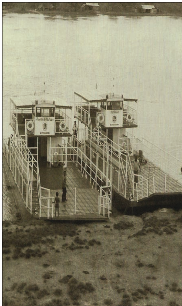
La “Puerto de Nutrias” y “La Unión”, de la flota de barcazas del estado Barinas, 1978.

Juan Bruno Delgado , general de división, natural de Obispos, es designado Juez Superior del antiguo estado Zamora.